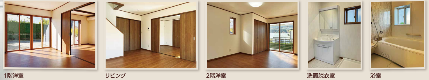
1階洋室 リビング 2階洋室 洗面脱衣室 浴室